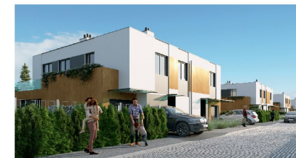
Widok budynku od strony osiedla