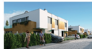
Widok budynku od strony ulicy