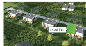
Widok osiedla z lotu ptaka