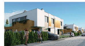
Widok budynku od strony ulicy